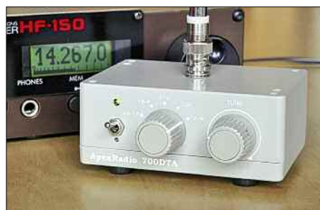
Das robuste Steuergerät der Innenantenne 700DTA nimmt über eine BNC-Buchse an der Oberseite das Empfangselement auf.

Lautsprecher des AOR AR7030. Als Referenzantenne diente ein etwa 10 m langer Empfangsdraht am Teleskopmast auf dem Balkon, eingespeist über den hochohmigen Eingang (Klemmbuchse) des Empfängers. Obwohl die Frequenz von SAQ außerhalb des offiziellen Empfangsbereichs der AKA-60 liegt, brachte diese im Vergleich zum Draht ein zwar merklich schwächeres Signal, das aber knapp über dem Rauschen noch deutlich lesbar war. Zur weiteren Einordnung folgte ein ausführlicher Vergleich mit der Wellbrook ALA1530 [3], einer bei BC-DXern verbreiteten breitbandigen Aktivantenne. Diese empfängt primär den magnetischen Teil eines elektromagnetischen Feldes und hat als Rahmen eine vor allem in den unteren Frequenzbereichen deutliche Richtwirkung. Beides brachte bis einschließlich der Mittelwelle den erwarteten Vorsprung: Zeitzeichensender auf 60 und 77,5 kHz, die BBC-Langwelle 198 kHz, die ungegerichtete Funkbake ERT auf 425 kHz und schwache Mittelwellensignale reichte die AKA-60 tagsüber trotz abgesetztem Betrieb, von einem deutlichen elektrischen Störpegel begleitet, an den Empfänger weiter. Im direkten Vergleich blieb der Empfang mit der ALA1530 deutlich störungsärmer, die aber dafür jeweils einer exakten Ausrichtung bedurfte.