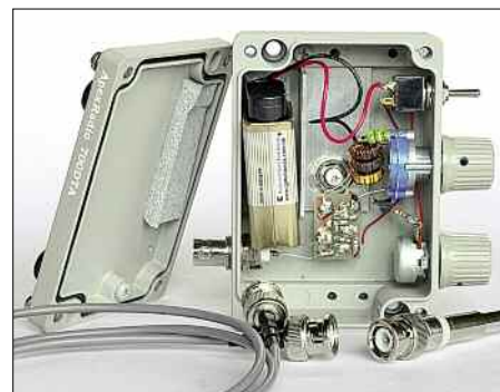
Die Stromversorgung der 700DTA übernimmt eine 9-V-Blockbatterie.

Beim Empfangstest am AOR AR7030 brachte die kleine Tischantenne tagsüber in allen KW-Bereichen respektable Ergebnisse, die oft recht nahe an die einer jetzt ebenfalls innen betriebenen ALA1530 [3] reichten. Erst bei Signalen an der Hörbarkeitsgrenze hatte Letztere deutliche Vorteile. Abends war man gelegentlich gut beraten, die Teleskopantenne der 700DTA teilweise oder komplett einzuschieben, um etwa im 40- und 30-m-Band auftretende Intermodulationsprodukte aus dem Antennenverstärker zu reduzieren. In anderen Bändern traten solche Effekte nicht auf