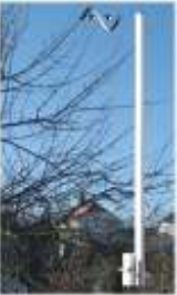
303WA-2 30kHz -30MHz passiv