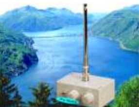
700DTA Aktive Preselektor Antenne INDOOR 0,5 MHz - 30 MHz