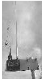
Gummiwendelantennen 4m Band bis 1200MHz